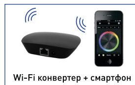
Рис. 1. Схема подключения контроллера.