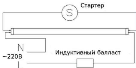
Рис.1. Схема люминесцентного светильник с индуктивным балластом