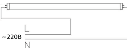
Рис.3. Схема подключения светодиодной лампы