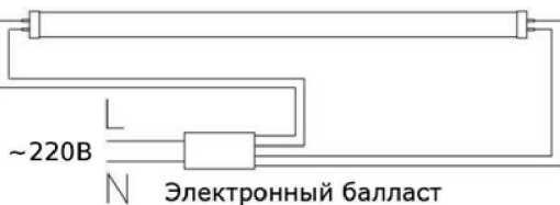
Рис.2. Схема люминесцентного светильник с электронным балластом